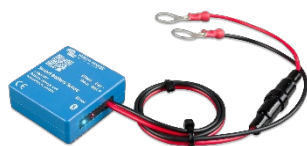
Detección de Bluetooth Smart Battery Sense