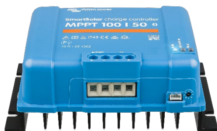
Controlador de carga SmartSolar MPPT 100/50