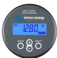
Detección de Bluetooth BMV-712 Smart Battery Monitor